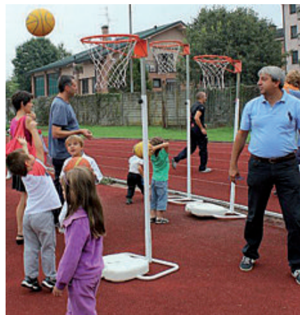
Non solo calcio. Alla Festa dello Sport ci si diletta con il basket, il tennis da tavolo, la danza e tante altre discipline