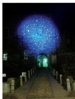
Le luci natalizie all'ingresso del Castello